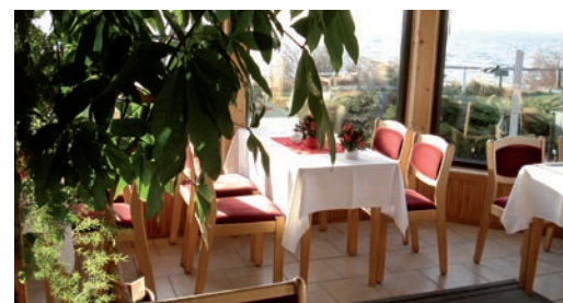
Oder die verglaste Veranda, von der aus die Kiter am Strand bestens zu sehen sind.