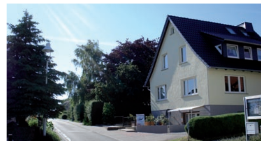
Wenige Meter weiter ist Haiko Milkes Kite-Fachgeschäft ProBoarding angesiedelt.