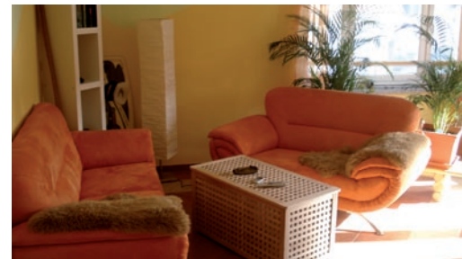
Das »Zollhaus« legt Wert auf helle und moderne Einrichtung.

Unten das Zollhaus mit herrlichem Blick auf das Kitesurf-Revier